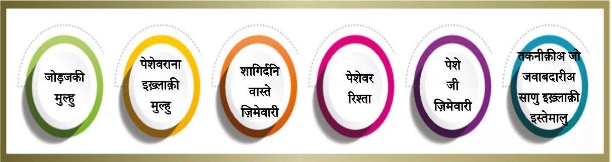
तस्वीर-3: बुनियादी मुल्हनि ऐं इख्लाकनि जी तस्वीर

हीउ पैमानो उन्हनि क्रदुरनि ऐं आचार-वीचारनि सां लागापियल खेत्रनि खे शामिलु कंदो जिनिजो विकासु करण जी उमेद हिक मास्तर मां कई वेंदी आहे । मास्तिरी पेशे में क्रदुर ऐं इख्लाकियत अहम किरदारु निभाईदा आहिनि, हू रहनुमा उसूलनि तौरु कमु कंदा आहिनि, जेके कक्षा जे अंदरि ईमानदारी, पेशेवराना सचाई, सन्मानु, वेसाहु ऐं बाहमी सम्झ जी ज़िमेवारी, जीअं मास्तरनि जे मूल्यनि जे पेशेवराना तरक्रीअ खे आकारु डींदा आहिनि, ऐं मास्तरनि खे पंहिजे मास्तिरी हुनर ऐं ताज़िंदगी नए सिखण खे लागीतो बहितरु बणाइण में मदद कंदा आहिनि । इन्हनि बुनियादी क्रदुरनि ऐं इख्लाकनि खे बणाए रखंदे, मास्तरु बराबरी ऐं शुमूलियत जो बुनियादु तयार कंदा आहिनि ।