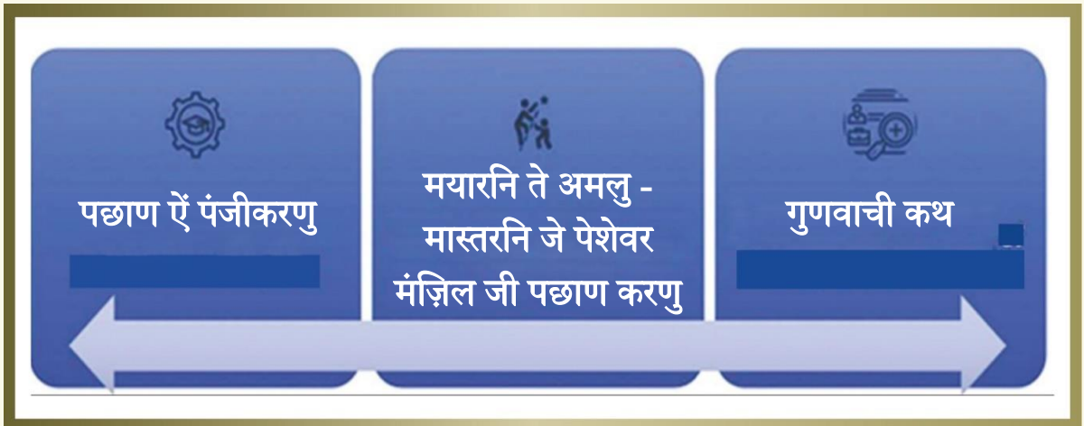
तस्वीर-8 शुरूआती (पायलट) अध्ययन ते अमल जी तस्वीर