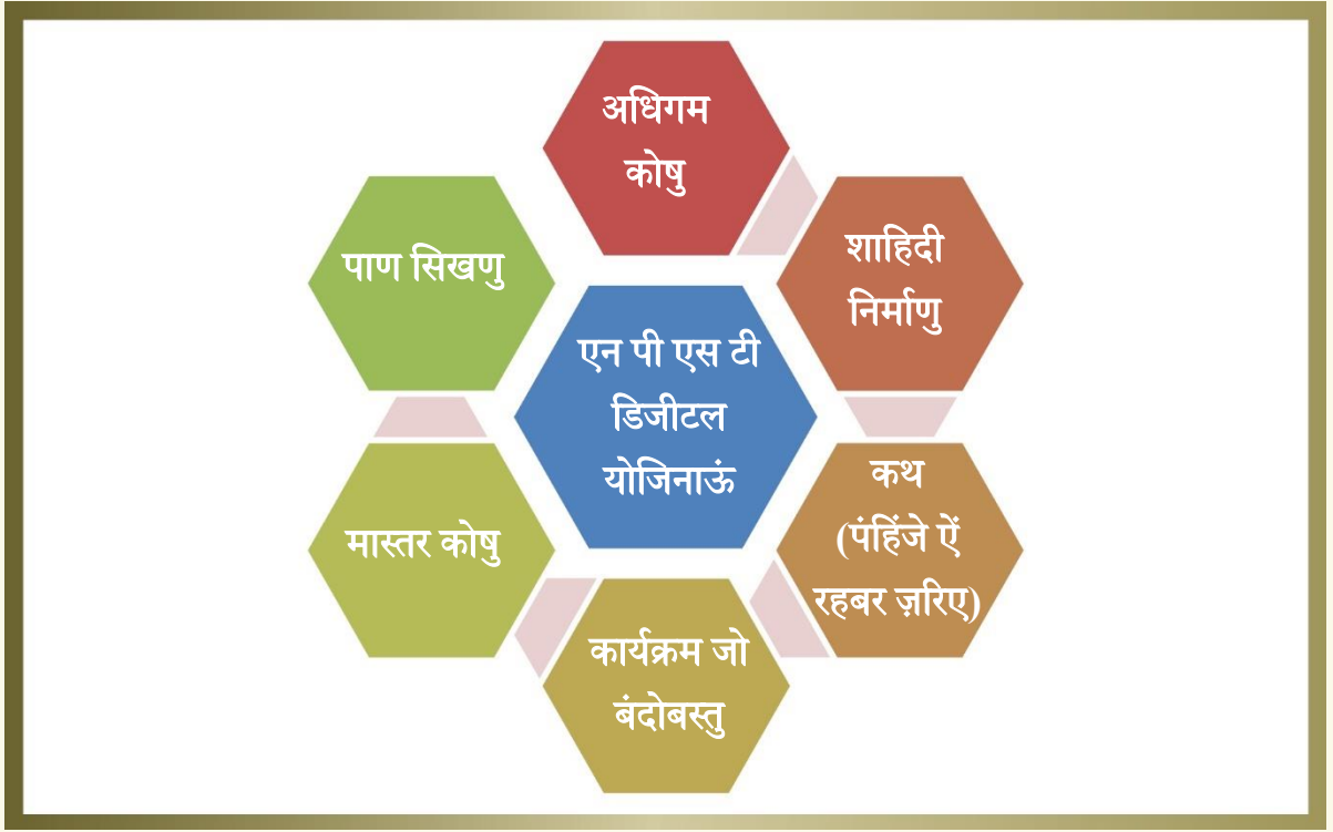
तस्वीर-7 डिजिटल योजिनाडनि जी तस्वीर