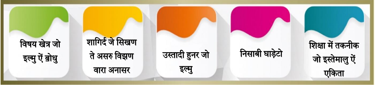
तस्वीर-4 इल्म ऐं अभ्यास ते ब्रधल तस्वीर

वसीउ आहे, जंहींमें विषय-वस्तु जो इल्मु, पाढ़ण जे लागापियल हुनुर जो उसूली इल्मु, विषय-वस्तु जी पेशकशि जे तरीकनि जो इल्मु, तालीमी मकसदनि जो इल्मु, राष्ट्रीय शिक्षा सिरिशते सां लागापियल नीतियुनि जो इल्मु, तारीख जो इल्मु, नएं सिखण जे उसूलनि जो इल्मु, नओं सिखण जे कम जी ख़ासि ज़रूरतुनि जो इल्मु, पाढ़ण जे तरीकनि जो इल्मु सभु शामिलु आहिनि। इनमें कुञ्जु इल्म ऐं पाढ़ण जे अभ्यास जे कमनि खे 'करण' जूं कुवतूं, वहिंवार ऐं भलावणि जी भाविना शामिलु थींदी आहे: शागिर्दनि खे शुमूली ऐं काराइते तौर ते शामिल करणु, रिथा ठाहिणु, पाढ़णु, कथ करण ऐं अकासी करणु, चूड करणु, विकसितु करणु ऐं कतबु आणणु गूनागूनु वाबस्ता जगहियुनि ऐं वसीलनि में जंहींमें क्लासु, पुस्तकालय, प्रयोगशाला, 'अध्ययन यात्राऊं' गलियारा ऐं रांदियुनि जा मैदान अची वेदा आहिनि, सिखण जे तजुर्बनि खे डिजाइन करणु ऐं हलाइण लाइ ऐं सभिनी शागिर्दनि खे समूरे तौर सिखण ऐं उसिरण में मदद करणु शामिलु आहे।