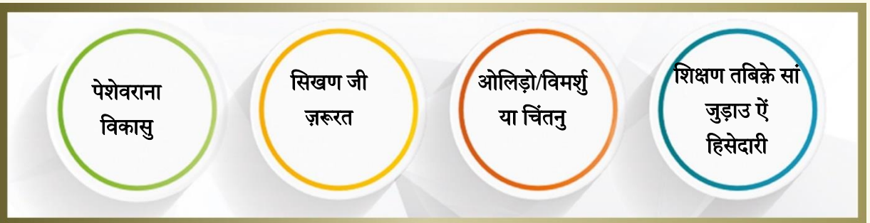
तस्वीर-5 पेशेवराना वाधि ऐं विकास जी तस्वीर

हीउ पैमानो लागीते पेशेवर विकास (कन्टीन्यूअस प्रोफेशनल डेवलपमेंट - सी पी डी) जे कार्यक्रम में हिसेदारी ज़रिए हर हिक पेशे जी मंज़िल ते पेशेवर इल्मु/कुवत ऐं अभ्यास में सुधार वास्ते हिक उस्ताद मां छा करण जी उमेद कई वेदी आहे उनसां लागापियल खेत्रनि खे पाण में शामिलु कंदो आहे। पेशेवर तौर मास्तरनि खे पंहिंजी पेशेवर सुजाणप खे अहमियत डियण ऐं पंहिंजी कुवतुनि खे वधाइण ऐं विकसितु करण लाइ लागीती कोशिश करण जी ज़रूरत आहे। जीअं त हिन दस्तावेज़ में कतब ईदड़ कुवतुनि जी अमली वस्फ़ में चिटो कयो वियो आहे माहिरियत, इल्मु, सुभाउ ऐं कुवतुनि जे इन्हनि सभिनी सरूपनि खे पाण में शामिलु करे थी।