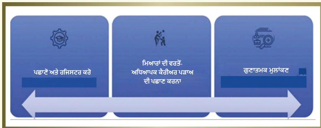
ਚਿੱਤਰ 8. ਪਾਇਲਟ ਸਟੱਡੀ ਲਾਗੂ ਕਰਨ ਬਾਰੇ ਦ੍ਰਿਸ਼ਟਾਂਤ