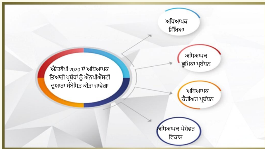
ਚਿੱਤਰ 1. ਅਧਿਆਪਕਾਂ ਦੀ ਤਿਆਰੀ ਬਾਰੇ ਚਿੱਤਰ

“ਨੈਸ਼ਨਲ ਪ੍ਰੋਫੈਸ਼ਨਲ ਸਟੈਂਡਰਡ ਫਾਰ ਟੀਚਰਜ਼ (ਐੱਨਪੀਐੱਸਟੀ) ਦਾ ਇੱਕ ਸਾਂਝਾ ਮਾਰਗਦਰਸ਼ਕ ਦਸਤਾਵੇਜ਼ ਸਮੂਹ ਇਸ ਦੇ ਨਵੇਂ ਰੂਪ ਵਿੱਚ, ਜਿਸ ਨੂੰ ਜਨਰਲ ਐਜੂਕੇਸ਼ਨ ਕੌਂਸਲ (GEC) ਦੇ ਤਹਿਤ ਪ੍ਰੋਫੈਸ਼ਨਲ ਸਟੈਂਡਰਡ ਸੈਂਟਿੰਗ ਬਾਡੀ (PSSB) ਵਜੋਂ, ਐੱਨ.ਸੀ.ਈ.ਆਰ.ਟੀ., ਐੱਸ.ਸੀ.ਈ.ਆਰ.ਟੀ., ਵਿਭਿੰਨ ਪੱਧਰਾਂ ਅਤੇ ਖੇਤਰਾਂ ਤੋਂ ਅਧਿਆਪਕਾਂ, ਅਧਿਆਪਨ ਅਤੇ ਵਿਕਾਸ ਵਿੱਚ ਵਿਦਵਾਨ ਸੰਸਥਾਵਾਂ, ਕਾਰਗੁਜ਼ਾਰੀ ਸਿੱਖਿਆ ਦੇ ਮਾਹਰ ਜ਼ਰੀਏ ਅਤੇ ਉੱਚ ਸਿੱਖਿਆ ਸੰਸਥਾਵਾਂ ਨਾਲ ਸਲਾਹਕਾਰੀ ਵਿਚਾਰ ਤੋਂ ਬਾਅਦ 2022 ਵਿੱਚ ਨੈਸ਼ਨਲ ਕੌਂਸਲ ਫਾਰ ਟੀਚਰਜ਼ ਐਜੂਕੇਸ਼ਨ ਦੁਆਰਾ ਵਿਕਸਤ ਕੀਤਾ ਜਾਵੇਗਾ। ਮਿਆਰ ਮੁਹਾਰਤ/ਪੜ੍ਹਾਅ ਦੇ ਵੱਖ-ਵੱਖ ਪੱਧਰਾਂ ਅਤੇ ਉਸ ਪੜ੍ਹਾਅ ਲਈ ਲੋੜੀਂਦੀਆਂ ਯੋਗਤਾਵਾਂ 'ਤੇ ਅਧਿਆਪਕ ਦੀ ਭੂਮਿਕਾ ਦੀਆਂ ਉਮੀਦਾਂ ਨੂੰ ਸ਼ਾਮਲ ਕਰਨਗੇ। ਇਸ ਵਿੱਚ ਹਰੇਕ ਪੜ੍ਹਾਅ ਲਈ ਮੁਲਾਂਕਣ ਪ੍ਰਦਰਸ਼ਨ ਲਈ ਮਾਪਦੰਡ ਵੀ ਸ਼ਾਮਲ ਹੋਣਗੇ, ਜੋ ਕਿ ਸਮੇਂ-ਸਮੇਂ 'ਤੇ ਕੀਤੇ ਜਾਣਗੇ। ਐੱਨਪੀਐੱਸਟੀ ਪੁਰਵ-ਸੇਵਾ ਅਧਿਆਪਕ ਸਿੱਖਿਆ ਪ੍ਰੋਗਰਾਮਾਂ ਦੇ ਡਿਜ਼ਾਈਨ ਨੂੰ ਵੀ ਸੂਚਿਤ ਕਰੇਗਾ। ਇਸ ਨੂੰ ਫਿਰ ਰਾਜਾਂ ਦੁਆਰਾ ਅਪਣਾਇਆ ਜਾ ਸਕਦਾ ਹੈ ਅਤੇ ਅਧਿਆਪਕ ਕੈਰੀਅਰ ਪ੍ਰਬੰਧਨ, ਕਾਰਜਕਾਲ ਸਮੇਤ, ਪੇਸ਼ੇਵਰ ਵਿਕਾਸ ਸੰਬੰਧੀ ਕੋਸ਼ਿਸ਼ਾਂ, ਤਨਖਾਹਾਂ ਵਿੱਚ ਵਾਧਾ, ਤਰੱਕੀਆਂ ਅਤੇ ਹੋਰ ਮਾਨਤਾਵਾਂ ਦੇ ਸਾਰੇ ਪਹਿਲੂਆਂ ਨੂੰ ਨਿਰਧਾਰਤ ਕੀਤਾ ਜਾ ਸਕਦਾ ਹੈ। ਤਰੱਕੀਆਂ ਅਤੇ ਤਨਖਾਹਾਂ ਵਿੱਚ ਵਾਧਾ ਕਾਰਜਕਾਲ ਜਾਂ ਸੀਨੀਅਰਤਾ ਦੀ ਮਿਆਦ ਆਧਾਰ 'ਤੇ ਨਹੀਂ, ਬਲਕਿ ਸਿਰਫ ਮੁਲਾਂਕਣ ਦੇ ਆਧਾਰ 'ਤੇ ਹੋਵੇਗਾ। ਪੇਸ਼ੇਵਰ ਮਾਪਦੰਡਾਂ ਦੀ 2030 ਵਿੱਚ ਸਮੀਖਿਆ ਅਤੇ ਸੰਸ਼ੋਧਨ ਕੀਤੀ ਜਾਵੇਗੀ, ਅਤੇ ਇਸ ਤੋਂ ਹਰ ਦਸ ਸਾਲਾਂ ਬਾਅਦ, ਸਿਸਟਮ ਦੀ ਪ੍ਰਭਾਵਸ਼ੀਲਤਾ ਦੇ ਸਖ਼ਤ ਅਨੁਭਵੀ ਵਿਸ਼ਲੇਸ਼ਣ ਦੇ ਆਧਾਰ ਸੁਧਾਰ ਕੀਤਾ ਜਾਵੇਗਾ”। [ਪੈਰਾ 5.20, NEP 2020]