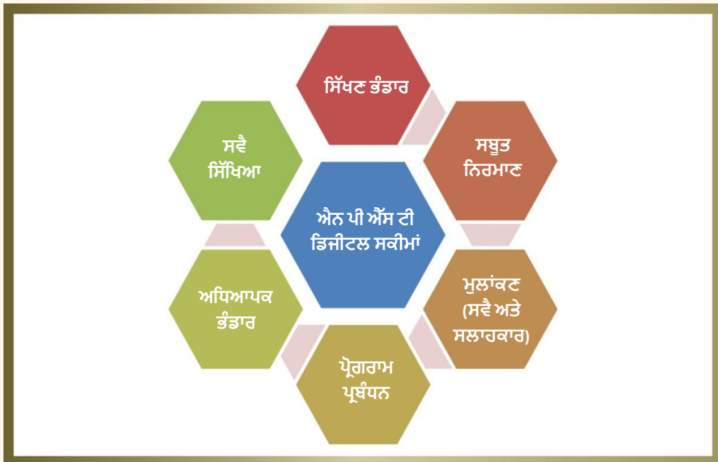
ਚਿੱਤਰ 7. ਡਿਜੀਟਲ ਸਕੀਮਾ ਉੱਤੇ ਚਿੱਤਰ