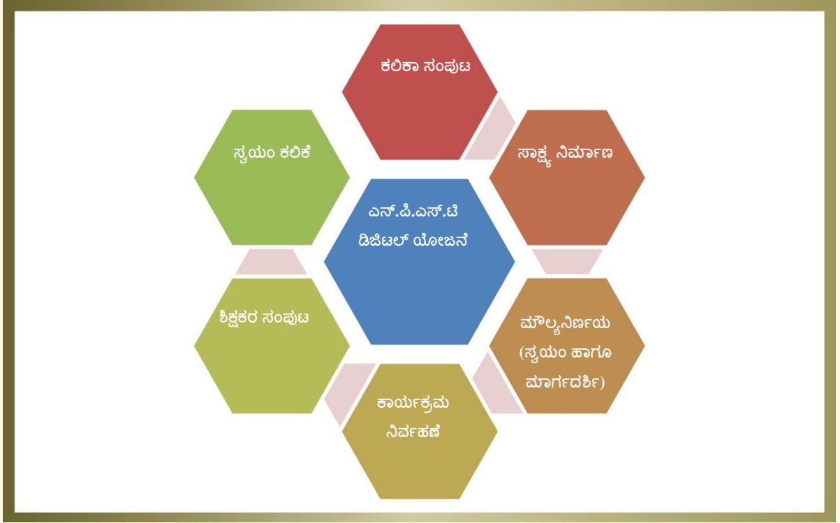
ಚಿತ್ರ 7. ಡಿಜಿಟಲ್ ಯೋಜನೆ ಬಗ್ಗೆ ಚಿತ್ರಣ