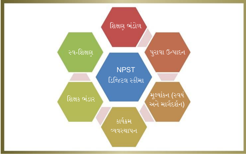
આકૃતિ ૭: ડિજિટલ સ્કીમ પર રેખાંકન