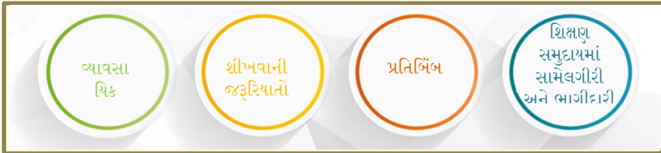
આકૃતિ ૫: વ્યવસાયિક વૃદ્ધિ અને વિકાસ પર રેખાંકન

૪.૩ માપદંડ ૩ : વ્યવસાયિક વૃદ્ધિ અને વિકાસ - આ માપદંડ સતત વ્યવસાયિક વિકાસ (કન્ટેનિયસ પ્રોફેશનલ ડેવલપમેન્ટ (CPD)) માટેના કાર્યક્રમોમાં ભાગીદારી દ્વારા કારકિર્દીના દરેક સ્તરે વ્યાવસાયિક જ્ઞાન/યોગ્યતા અને અભ્યાસને સુધારવા માટે શિક્ષક પાસે શું કરવાની અપેક્ષા રાખવામાં આવે છે તેને સંબંધિત ક્ષેત્રોને આવરી લે છે. શિક્ષકોએ એક વ્યવસાયિક તરીકે પોતાની વ્યવસાયિક ઓળખનું મૂલ્ય કરવાની જરૂર છે અને પોતાની યોગ્યતાઓની વૃદ્ધિ અને વિકાસ માટે સતત પ્રયાસ કરવો જોઈએ. આ દરતાવેજમાં ઉપયોગમાં લેવાયેલી યોગ્યતાની કાર્યકારી વ્યાખ્યા પ્રમાણે, તે જ્ઞાન, અભિગમ અને ક્ષમતાને આવરી લે છે.