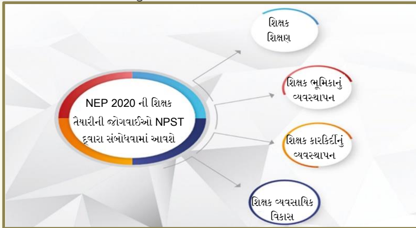
આકૃતિ ૧: શિક્ષકોની તૈયારી પરનું રેખાંકન

"એનસીટીઈ NCTE દ્વારા એનસીઈઆરટી એસસીઈઆરટી NCERT, SCERT બધાં સ્તર અને ક્ષેત્રોના શિક્ષકો, શિક્ષકોની તૈયારી અને વિકાસ હેતુ, સંસ્થાનો અને ઉચ્ચતર શિક્ષણ સંસ્થાનો સાથે વાતચીતથી સામાન્ય ધોરણ પરિષદ (GEC) હેઠળ તેના પુનર્ગઠન નવા સ્વરૂપમાં નેશનલ પ્રોફેશનલ સ્ટાન્ડર્ડ્સ ફોર ટીચર્સ (એનપીએસટી NPST)નો એક સામાન્ય માર્ગદર્શક સમૂહ વર્ષ ૨૦૨૨ સુધીમાં વિકસાવવામાં આવશે. આ ધોરણોમાં કુશળતા/તબક્કાના વિવિધ સ્તરે શિક્ષકની ભૂમિકાની અપેક્ષાઓ અને તે તબક્કા માટે જરૂરી ક્ષમતાઓને આવરી લેવામાં આવશે. તેમાં તેના માટેના માપદંડોનો પણ સમાવેશ થશે. દરેક તબક્કા માટે કામગીરીનું મૂલ્યાંકન સમયાંતરે હાથ ધરવામાં આવશે. એનપીએસટી NPST, પૂર્વ સેવા પ્રશિક્ષણ કાર્યક્રમોના માળખાંની પણ જાણકારી આપશે. ત્યારબાદ રાજ્યો દ્વારા તેને અપનાવી શકાય છે અને શિક્ષક કારકિર્દી વ્યવસ્થાપનનાં તમામ પાસાંઓ નક્કી કરી શકાય છે, જેમાં કાર્યકાળ, વ્યાવસાયિક વિકાસના પ્રયાસો, પગાર વધારો, બઢતી અને અન્ય માન્યતાનો સમાવેશ થાય છે. બઢતી અને પગાર વધારો કાર્યકાળ કે વરિષ્ઠતાના આધારે નહીં થાય, પરંતુ આવા મૂલ્યાંકનના આધારે જ થશે. વ્યાવસાયિક ધોરણોની સમીક્ષા કરવામાં આવશે અને વર્ષ ૨૦૩૦માં રાષ્ટ્રીય સ્તરે વ્યાવસાયિક ધોરણોની સમીક્ષા અને સંશોધન કરવામાં આવશે અને ત્યારબાદ દર દસ વર્ષોમાં વ્યવસ્થાની ગુણવત્તાનું ધનિષ્ઠ અનુભવ આધારિત વિશ્લેષણ કરવામાં આવશે અને તેમાં આવશ્યક સુધારો કરવામાં આવશે."