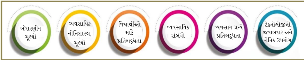
આકૃતિ ૩: આંતરિક મૂલ્યો અને નૈતિકતા પર રેખાંકન

૪.૧ માપદંડ ૧: આંતરિક મૂલ્યો અને નૈતિકતા - આ માપદંડ શિક્ષકે પોતાનામાં જાગૃત કરવાના આંતરિક મૂલ્યો અને નૈતિકતાને લગતા મુદ્દાઓ આવરે છે. આંતરિક મૂલ્યો અને નૈતિકતા શિક્ષણના વ્યાવસાયમાં નિર્ણાયક ભૂમિકા ભજવે છે. તેઓ માર્ગદર્શક સિદ્ધાંત તરીકે સેવા આપે છે જે શિક્ષકના મૂલ્યોના વિકાસ ને વ્યાવસાયિક આકાર આપે છે જેમ કે સૈનિષ્ટતા, વ્યાવસાયિકરણ, પ્રામાણિકતા, આદર, વિશ્વાસ અને વર્ગખંડમાં પરસ્પર સમજણ, અને શિક્ષકોની કુશળતા અને આજીવન ચાલતા અધ્યયનને સતત સુધારવામાં મદદ કરે છે. આંતરિક મૂલ્યો અને નૈતિકતાનું આચરણ કરીને, શિક્ષકો એક સમાન અને સમાવેશી સમાજ માટેનો પાયો નાખે છે.