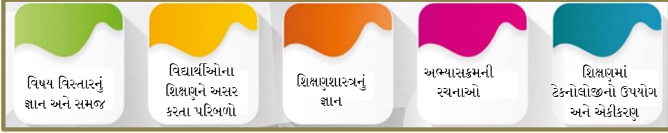
આકૃતિ ૪: જ્ઞાન અને અભ્યાસ પર રેખાંકન

યોજના કરવા, શીખવવા, મૂલ્યાંકન અને ચિંતા કરવા, પસંદ કરવા, વિકાસ કરવા અને સંસાધનોનો ઉપયોગ કરવા, ડિઝાઇન કરવા અને શિક્ષણના અનુભવો અલગ અભ્યાસક્રમની જગ્યાઓ વર્ગખંડ, પુસ્તકાલય, પ્રયોગશાળા, 'ફીલ્ડ'ની મુલાકાતો, પરિસરમાં કે રમતના મેદાનમાં પણ વિદ્યાર્થીઓને સર્વગ્રાહી રીતે શીખવા અને વિકાસ કરવા માટે મદદ આપવી.