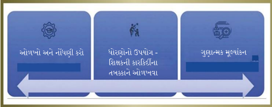
આકૃતિ ૮: પ્રયોગાત્મક અભ્યાસ અમલીકરણ પર રેખાંકન