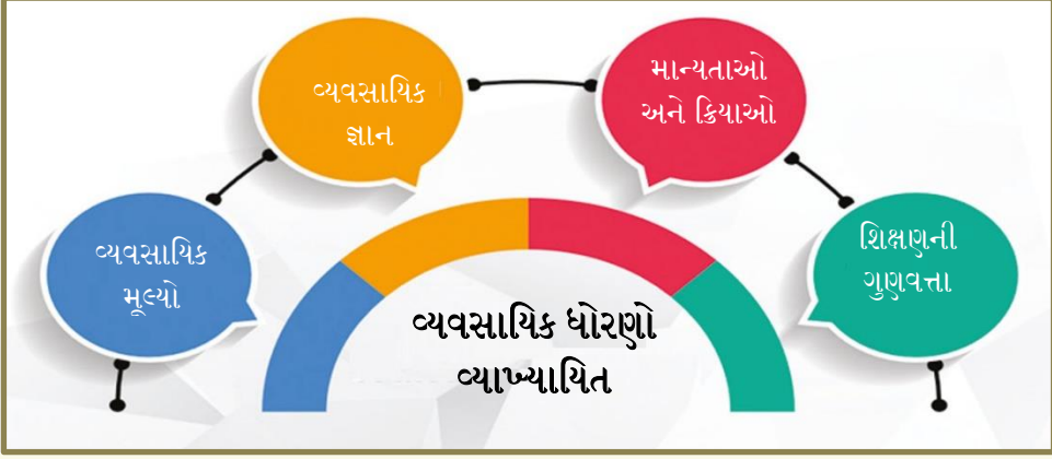
આકૃતિ ૨: વ્યાવસાયિક માપદંડ અને યોગ્યતા પર રેખાંકન

શિક્ષણ વ્યાવસાયિકોને એકસાથે આવરી લેતી મૂળભૂત વ્યાખ્યામાં પણ આવરી શકાય છે અથવા કારકિર્દીના વિવિધ તબક્કામાં શિક્ષકો માટે પ્રવીણ થી નિષ્ણાત એમ દરેક સ્તર સુધીનો રોડમેપ પૂરો પાડે છે.