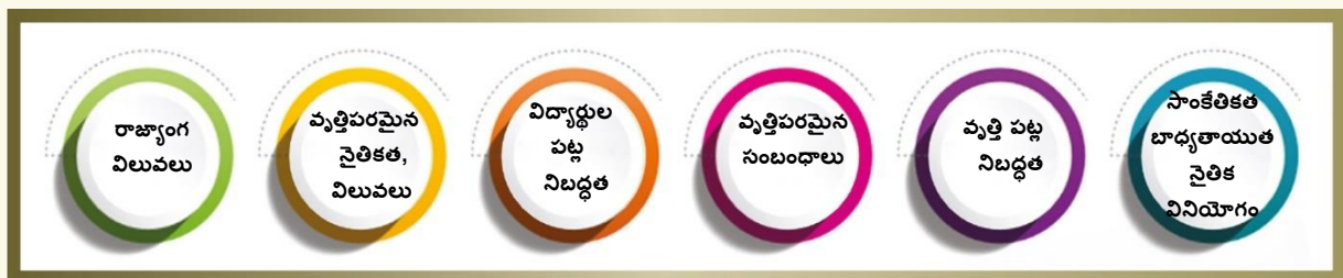
చిత్రం. 3 ప్రధాన విలువలు, నైతికతలపై దృష్టాంతం

4.1 ప్రమాణం 1: ప్రధాన విలువలు & నైతికత - ఈ ప్రమాణం ఉపాధ్యాయుడు అభివృద్ధి చేయాలని భావిస్తున్న ప్రధాన విలువలు, నైతికతకు సంబంధించిన క్షేత్రాలను కలుపుతుంది. ఉపాధ్యాయ వృత్తిలో ప్రధాన విలువలు, నైతికత కీలక పాత్రను పోషిస్తాయి. అవి ఉపాధ్యాయుల విలువల వృత్తిపరమైన అభివృద్ధిని రూపొందించే మార్గదర్శక సూత్రాలుగా పనిచేస్తాయి. అవి సమగ్రత, వృత్తి నైపుణ్యం, నిజాయితీ, గౌరవం, విశ్వాసం, తరగతి గదిలో పరస్పర అవగాహన, ఉపాధ్యాయులు వారి బోధనా నైపుణ్యాలను, జీవితకాల అభ్యసనాన్ని నిరంతరం మెరుగుపరచడంలో సహాయపడతాయి. ఈ ప్రధాన విలువలు, నైతికతలను సమర్థించడం ద్వారా ఉపాధ్యాయులు సమానత్వం, సమ్మిళితత్వానికి పునాదిని సృష్టించడం జరుగుతుంది.