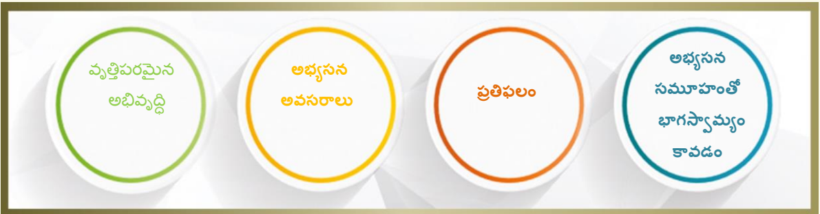
చిత్రం. 5 వృత్తిపరమైన పెరుగుదల - అభివృద్ధిపై దృష్టాంతం

4.3 ప్రమాణం 3: వృత్తిపరమైన పెరుగుదల - అభివృద్ధి - ఈ ప్రమాణం నిరంతర వృత్తిపరమైన అభివృద్ధి (సిపిడి) కోసం కార్యక్రమాలలో పాల్గొనడం ద్వారా ప్రతి దశలో వృత్తిపరమైన జ్ఞానం/సామర్థ్యం, అభ్యసనాన్ని మెరుగుపరచడానికి ఉపాధ్యాయులు ఏమి చేయాలో దానికి సంబంధించిన క్షేత్రాలను సూచిస్తుంది. నిపుణులుగా ఉపాధ్యాయులు తమ వృత్తిపరమైన గుర్తింపుకు విలువనివ్వాలి. వారి సామర్థ్యాలు పెరుగుదలకు, అభివృద్ధి చెందడానికి నిరంతరం కృషి చేయాలి. ఈ పత్రంలో ఉపయోగించబడిన సామర్థ్య కార్యాచరణ నిర్వచనంలో స్పష్టం చేయబడినట్లుగా, సామర్థ్యం అనేది ఇటువంటి అన్నిరకాల జ్ఞానం, స్వభావాలు, సామర్థ్యాలను సూచిస్తుంది