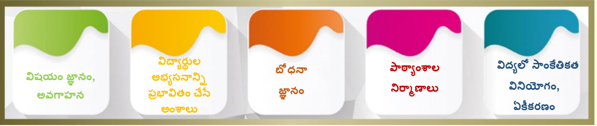
చిత్రం. 4 జ్ఞానం - అభ్యాసం పై దృష్టాంతం

విషయ పరిజ్ఞానం, సబ్జెక్ట్‌ను ప్రదర్శించే మార్గాల జ్ఞానం, విద్యా లక్ష్యాలు, జాతీయ విద్యా వ్యవస్థల పరిజ్ఞానం, విధానాలు, చరిత్ర, అభ్యసన సిద్ధాంతం, సందర్భాలు, విద్యా అభ్యసనాల పరిజ్ఞానం, అభ్యాసకుడి నిర్దిష్ట జ్ఞానాన్ని కలిగి ఉంటుంది. జ్ఞానం, సాధన అనేది పనులను 'చేయడానికి' సామర్థ్యాలు, స్వభావాలను, బాధ్యతా భావాన్ని కలిగి ఉంటుంది: విద్యార్థులను కలుపుకొని, అర్థవంతంగా నిమగ్నం చేయడం, ప్రణాళిక వేయడం, బోధించడం, అంచనా వేయడం, ప్రతిబింబించడం, వనరులను ఎంచుకోవడం, అభివృద్ధి చేయడం, ఉపయోగించడం, అభ్యసనాన్ని రూపొందించడం, నిర్వహించడం, తరగతి గది, గ్రంథాలయం, ప్రయోగశాల, 'క్షేత్ర పర్యటనలు', మైదానాలతో సహా విభిన్న పాఠ్యాంశాలలో అనుభవాలు, విద్యార్థులందరూ సమగ్రంగా నేర్చుకునేందుకు ఇంకా అభివృద్ధి చెందడానికి తోడ్పడతాయి.