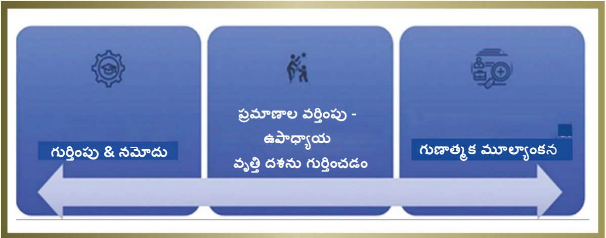
చిత్రం. 8 ప్రయోగాత్మక అధ్యయనం అమలు పై దృష్టాంతం