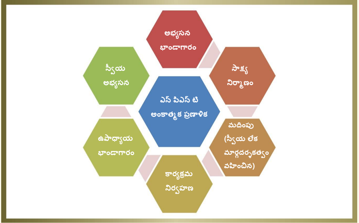
చిత్రం. 7 అంకాత్మక ప్రణాళికపై దృష్టాంతం