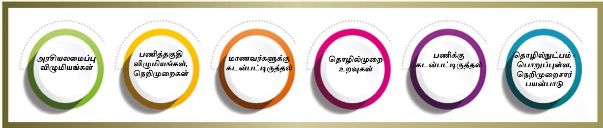
படம். 3 முக்கிய விழுமியங்களும் நெறிமுறைகளும் விளக்கப்படம்

4.1 தரநிலை 1: முக்கிய விழுமியங்களும் நெறிமுறைகளும் – இந்தத் தரநிலையானது, ஒரு ஆசிரியரிடத்தில் எதிர்பார்க்கப்படும் முக்கிய விழுமியங்கள் மற்றும் நெறிமுறைகள் தொடர்பான களங்களை உள்ளடக்கியதாக இருக்கும். விழுமியங்கள் மற்றும் நெறிமுறைகள் ஆசிரியர் பணியில் முக்கியப் பங்கு வகிக்கின்றன. உண்மையான அர்ப்பணிப்பு, தொழில்முறை திறன், நேர்மை, மரியாதை, நம்பிக்கை, மாணவர்களுடன் பரஸ்பரப் புரிதல் முதலியவையே ஆசிரியர்களின் தொழில்முறை வளர்ச்சியை வடிவமைக்கும் வழிகாட்டுக் கொள்கைகளாகச் செயல்படுகின்றன. மேலும், இவை ஆசிரியர்கள் தங்கள் கற்பித்தல் திறன்களை மேம்படுத்துவதோடு வாழ்நாள் முழுவதும் கற்றலையும் தொடர்ந்து செம்மைப்படுத்த உதவுகின்றன. இந்த அடிப்படை விழுமியங்களையும் நெறிமுறைகளையும் நிலைநிறுத்துவதன் மூலம், ஆசிரியர்கள் சமத்துவம் மற்றும் ஒப்புரவுள்ள கல்வி முறைமைக்கான அடித்தளத்தை உருவாக்குகிறார்கள்.