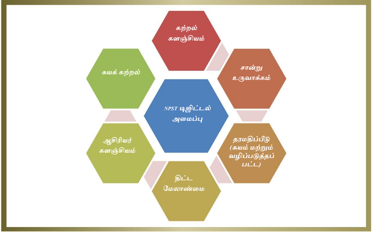
படம். 7. டிஜிட்டல் அமைப்பு விளக்கப்படம்