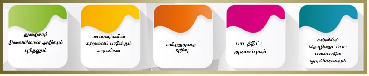
படம். 4 அறிவும் பயிற்சியும் பற்றிய விளக்கம்

4.3 தரநிலை 3: தொழில்முறை வளர்ச்சியும் மேம்பாடும் – தொடர்ச்சியான தொழில்சார் மேம்பாட்டிற்கான (CPD) திட்டங்களில் பங்கேற்பதன் மூலம் ஒவ்வொரு பணிநிலையிலும் தொழில்முறை அறிவு/திறன் மற்றும் பயிற்சியை மேம்படுத்த ஒரு ஆசிரியரிடம் என்ன எதிர்பார்க்கப்படுகிறது என்பது தொடர்பான களத்தை இந்தத் தரநிலை உள்ளடக்கியுள்ளது. ஆசிரியர்கள் வல்லுநர்களாகத் தங்கள் தொழில்முறை அடையாளத்தை மதிக்க வேண்டும் மற்றும் தொடர்ந்து முயற்சிகளை மேற்கொண்டு தங்கள் திறன்களைப் பெருக்கிக் கொள்ள வேண்டும். இந்த ஆவணத்தில் பயன்படுத்தப்படும் திறன் என்பதற்கான செயல்பாட்டு வரையறையில் தெளிவுபடுத்தப்பட்டுள்ள படி, திறன் என்பது அனைத்து வகையான அறிவு, மனவியல்புகள் மற்றும் ஆற்றல் களை உள்ளடக்கியதாகும்.