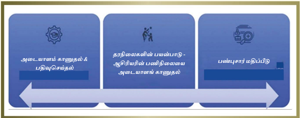
படம். 8. முன்னோட்ட ஆய்வு நடைமுறைப்படுத்தல் பற்றிய விளக்கம்