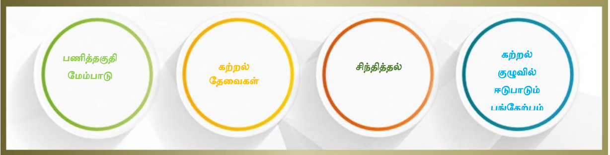
படம். 5 தொழில்முறை வளர்ச்சி மற்றும் மேம்பாடு பற்றிய விளக்கம்

4.3 தரநிலை 3: தொழில்முறை வளர்ச்சியும் மேம்பாடும் – தொடர்ச்சியான தொழில்சார் மேம்பாட்டிற்கான (CPD) திட்டங்களில் பங்கேற்பதன் மூலம் ஒவ்வொரு பணிநிலையிலும் தொழில்முறை அறிவு/திறன் மற்றும் பயிற்சியை மேம்படுத்த ஒரு ஆசிரியரிடம் என்ன எதிர்பார்க்கப்படுகிறது என்பது தொடர்பான களத்தை இந்தத் தரநிலை உள்ளடக்கியுள்ளது. ஆசிரியர்கள் வல்லுநர்களாகத் தங்கள் தொழில்முறை அடையாளத்தை மதிக்க வேண்டும் மற்றும் தொடர்ந்து முயற்சிகளை மேற்கொண்டு தங்கள் திறன்களைப் பெருக்கிக் கொள்ள வேண்டும். இந்த ஆவணத்தில் பயன்படுத்தப்படும் திறன் என்பதற்கான செயல்பாட்டு வரையறையில் தெளிவுபடுத்தப்பட்டுள்ள படி, திறன் என்பது அனைத்து வகையான அறிவு, மனவியல்புகள் மற்றும் ஆற்றல் களை உள்ளடக்கியதாகும்.