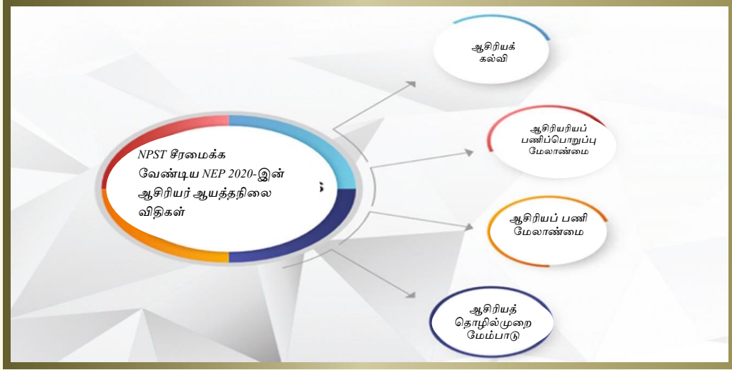
படம். 1 ஆசிரியர்களின் ஆயத்தநிலை பற்றிய விளக்கப்படம்