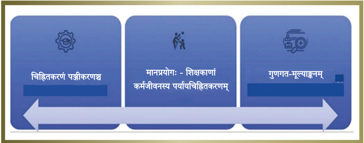
चित्रम् - ८, कर्णधाराध्ययनव्यवहारविषये चित्रोदाहरणम् ।