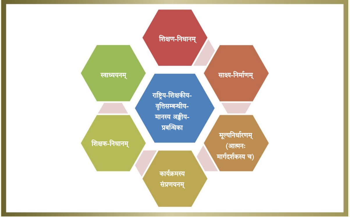
चित्रम् - ७, अङ्कीय-प्रबन्धिकाविषये चित्रोदाहरणम्