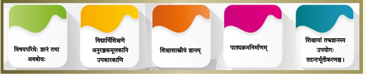
चित्रम् ४ - ज्ञानम् अभ्यासश्चेति विषये चित्रोदाहरणम् ।

‘करणीयम्’ इत्यस्य कृते सामर्थ्यं स्वभावञ्च नियोजयति, तथा च विद्यार्थिनां विशेषतया यथार्थतया च नियोक्तुं, परिकल्पयितुं, शिक्षयितुं, मूल्याङ्कयितुं, प्रतिफलितुम्, उन्नतिं तथा व्यवहृतसम्पदां चेतुं, विविधकार्यक्रमस्यान्तर्जाले शिक्षणानुभवस्य, श्रेणिकक्षायाः, ग्रन्थागारस्य, रसायनकर्मशालायाः, स्थानान्तरनिरीक्षणस्य, उपकक्षाणां, क्रीडाप्राङ्गणस्य च परिकल्पनां रचयितुं, तथा च सामग्रिकतयाभ्युन्नतये सर्वेषां विद्यार्थिनां समर्थने सहायतां करोति ।