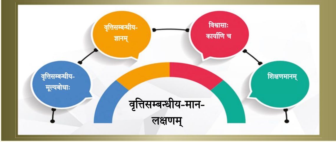
चित्रम् -२ - वृत्तिसम्बन्धीय-मानानि योग्यताविषये च चित्रोदाहरणम्

राष्ट्रीय-शिक्षा-नीतिः २०२० इत्यस्योद्देश्यपूर्तये, पूर्वोल्लिखितक्षेत्रत्रयं परिव्याप्य मानानि विद्यन्ते, यानि शिक्षकतावृत्तियुक्तानां समग्रजीवनस्य कर्मजीवनविवर्तनस्य व्याप्यर्थं विस्तृततया संज्ञायितं कुर्वन्ति। राष्ट्रिय-शैक्षिकानुसंधानस्य प्रशिक्षणस्य च परिषदा (NCERT), राज्य-शैक्षिकानुसंधानस्य प्रशिक्षणस्य च परिषदा (SCERT), सर्वस्तरस्य स्थानस्य च शिक्षकैः, शिक्षकप्रस्तुतेः अभ्युन्नतेश्च विशेषज्ञसंस्थानैः, विशेषज्ञसंस्थाभिः, उच्चशिक्षासंस्थाभिश्च सह विमृष्य राष्ट्रिय-शिक्षकीय-वृत्तिसम्बन्धीय-मानस्य एका साधारणनिर्देशिका सम्पादिता।