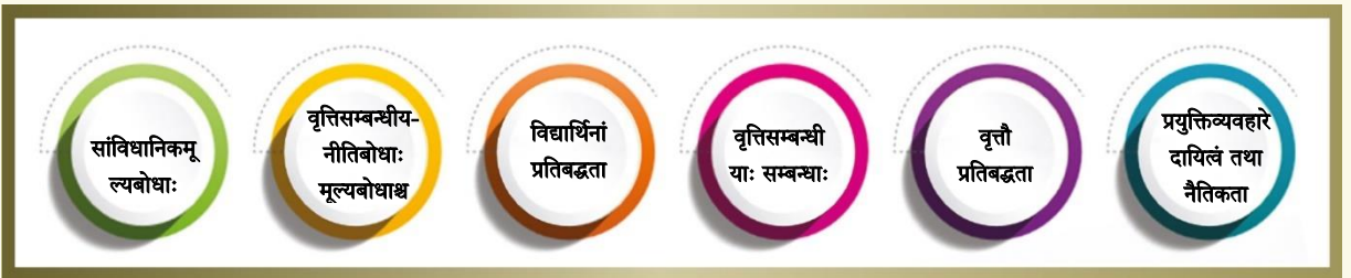
चित्रम् ३ - मौलिकमूल्यबोधविषये तथा नैतिकताबोधविषये चित्रोदाहरणम्

४.१ प्रथममानम् - मौलिकमूल्यबोधाः नैतिकताश्च - मानमिदं मौलिक-मूल्यबोधसम्पर्कितं तथा नैतिकतासम्पर्कितं क्षेत्रं परिव्याप्नोति येषां मूल्यबोधानां समुन्नतिसाधने एकः शिक्षकः इति अपेक्षते। शिक्षणवृत्तौ मौलिकमूल्यबोधानां नैतिकतानाञ्च गुरुत्वपूर्णा भूमिका विद्यते। एते मूल्यबोधाः तत्त्वावधायकनीतिरूपेण सेवन्ते, यत् शिक्षकमूल्यबोधानां वृत्तिसम्बन्धीयाभ्युन्नतेः रूपं ददाति यथा सत्यशीलता, प्रामाणिकता, सन्मानम्, विश्वासः, श्रेणिकक्षायां पारस्परिकसम्पर्कस्य प्रतिश्रुतिः, शिक्षकाणां शिक्षागतदक्षता, जीवनव्याप्यशिक्षणं परिमार्जयितुं सहायतां करोति। एतेषां मूल्यबोधानां नैतिकतानाञ्च दृढं स्थापनमाध्यमेन शिक्षकाः समतायाः तथा निर्मान्ति।