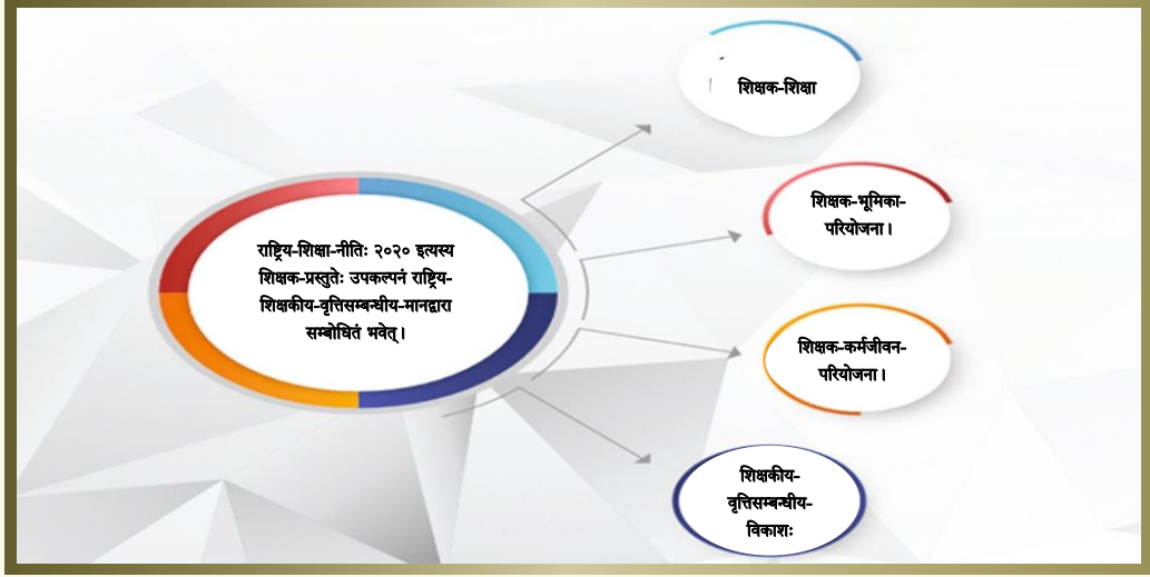
चित्रम्, १ - शिक्षकीय-सज्जतायाः चित्रोदाहरणम् ।

३.१.१ शिक्षक-शिक्षा: राष्ट्रिय-शिक्षकीय-वृत्तिसम्बन्धीय-मानं सेवापूर्व-शिक्षकशिक्षाकार्यक्रमस्य ४वर्षीयस्य २वर्षीयस्य तथा १वर्षीयस्य शिक्षाशास्त्रीकार्यक्रमस्य प्रारूपं सूचयिष्यति यथा राष्ट्रिय-शिक्षा-नीति: २०२० इत्यनया परिकल्पितं वर्तते ।