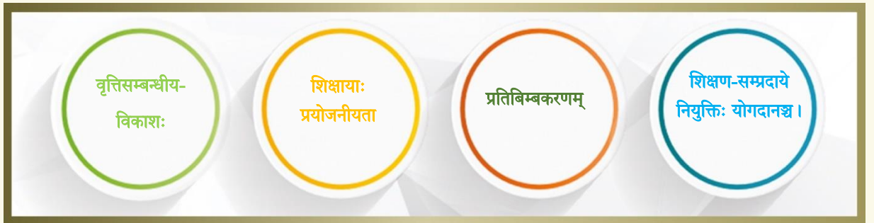
चित्रम् - ५, ५. वृत्तिसम्बन्धीययाः अग्रगतेः उन्नतेश्च विषये चित्रोदाहरणम् ।

४.३ तृतीयमानम्-वृत्तिसम्बन्धीया वृद्धिः अभ्युन्नतिश्च - प्रत्येकं कर्मजीवनस्तरे कार्यकारितया कर्मसम्पादनाय विद्यार्थिविषये, शिक्षण-शिक्षा-विषये एकस्मिन् शिक्षके वृत्तिसम्बन्धीयज्ञानस्य/योग्यतायाः समुन्नतिः - यदपेक्षणीयं, तद्विषयं परिव्याप्नोति मानमिदं, नियत-वृत्तिसम्बन्धीयाभ्युन्नतिमूलककार्यक्रमे अंशग्रहणमाध्यमेन । शिक्षणयोग्यतायाः वृद्ध्यर्थम् अभ्युन्नत्यर्थं च वृत्त्यनुसारं शिक्षकैः वृत्तिं प्रति तथा उद्यमं प्रति गुरुत्वं प्रदेयम् । योग्यतायाः व्यवहारोपयोगिपरिभाषायां सुस्पष्टानुसारं यत् अस्मिन् लेखपत्रे व्यवहृतं विद्यते तत् ज्ञानस्य, स्वभावस्य, दक्षतायाश्च सर्वाणि रूपाणि परिव्यप्योति ।