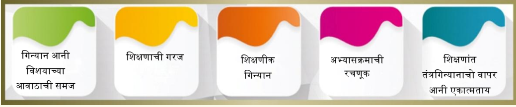
चित्र.4 गिन्यान आनी सरावाचें रेखाटण

भोंवडी, वारांद आनी खेळाचें मैदान हाचे वांगडाच वेग-वेगळ्या अभ्यासक्रमांच्या सायटींचेर शिकपाचे अणभव डिझायन करप, पुराय करप आनी सगळ्या विद्यार्थ्यांक सगळे तरेन शिकपा खातीर आनी विकास करूंक मजत करप.