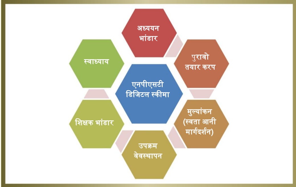
आकृती 7 डिजिटल स्कीमा वयलें रेखाटण