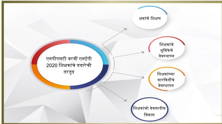
चित्र 1. शिक्षकांच्या तयारेचें रेखाटण

राष्ट्रीय शिक्षक शिक्षण परिशद (नॅशनल कावन्सील फॉर टीचर एज्युकेशन), सामान्य शिक्षण परिशद (जनरल एज्युकेशन कावन्सील-GEC) हाचे खाला वेवसायीक मानक स्थापना संस्था (प्रॉफेशनल स्टॅण्डर्ड सॅटींग बोर्डी-PSSB) हे आपले नव्या पुनर्रचित स्वरुपांतल्यान, एनसीईआरटी (NCERT), एससीईआरटी (SCERTs), वेगवेगळे पांवडे आनी प्रदेशांतले शिक्षक, शिक्षक तयारी आनी विकासांतल्यो तज्ञ संस्था, वेवसायीक शिक्षणांतल्यो तज्ञ संस्था आनी उच्च शिक्षणीक संस्था हांचे वांगडा सल्लो मसलत करून, शिक्षकां खातीर राष्ट्रीय वेवसायीक मानकां हांचो एक सर्वसामान्य मार्गदर्शक संच 2022 मेरेन विकसीत करतली. कौशल्याच्या/ पदांच्या वेगवेगळ्या पांवड्यांचेर शिक्षकाच्या भूमिकेच्यो अपेक्षा आनी ताचे खातीर जाय आशिल्ल्यो क्षमता हांचो आसपाव ह्या मानकांत करतले. हातूंत कामगिरीचे मोलावणी खातीर, दर पांवड्या खातीर थारावन दिल्ल्या मानकांचोय आसपाव आसतलो आनी ही मोलावणी वेळा-वेळार करतले. एनपीएसटी सेवा-पूर्व शिक्षक शिक्षण कार्यावळीचे रचणुके विशींचीय माहिती दितली. ताचे उपरांत, राज्यां तीं आपणावंक शकतलीं आनी तांचे आदाराचेर कार्यकाळ, वेवसायीक विकासाचे यत्न, पगारवाड, बडटी आनी हेर मान्यतायो हांचे सयत शिक्षक कारकीर्द वेवस्थापनाचे सगळे पैलू थारावंक शकतलीं. कार्यकाळ वा वरिश्ठताय हांचे आदाराचेर बडटी वा पगारवाड जावची ना, तर ती फकत अशे तरेचे मोलावणीचे आदाराचेरूच जातली. हे यंत्रणेच्या परिणामकारकतायेचें जुस्ताजुस्त, अणभवजन्य विश्लेशण करून ताचे आदाराचेर वेवसायीक मानकांची नियाळणी आनी सुदारणां 2030 वर्साक आनी ताचे उपरांत दर धा वर्सांनी करतले. कारकीर्द [परिच्छेद 5.20, एनईपी 2020]