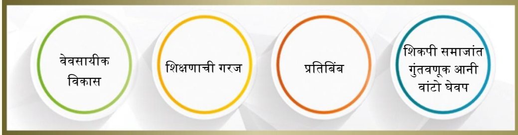
चित्र.5 वेवसायीक वाड आनी विकास हाचें रेखाटण

4.3 मानक 3: वेवसायीक वाड आनी विकास हें मानक सदांच वेवसायीक विकास (सीपीडी) कार्यावळींत वांटेकार जावन दर एका कारकीर्द पांवड्यार वेवसायीक गिन्यान/ क्षमता आनी सराव सुदारपा खातीर शिक्षकांनी किदें करपाची आस्त आसा हाचे संबंदांत क्षेत्राचो आसपाव जाता. वेवसायीक म्हणून, शिक्षकान ताचे वेवसायीक वळखीक म्हत्व दिवप गरजेचें आसा आनी ताची क्षमता वाडोवपा खातीर आनी विकासाक पावोवपा खातीर सातत्यान यत्न करप गरजेचें आसा. ह्या दस्तावेजांत वापरांत येवपी क्षमतेच्या ऑपरेशनल व्याख्येंत स्पश्ट केल्ले प्रमाणें, योग्यताय वा सगळ्या प्रकाराचें गिन्यान, सभाव आनी क्षमतेचो आसपाव करता.