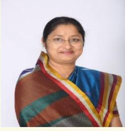
अन्नपूर्णा देवी माननीय शिक्षण राज्यमंत्री शिक्षण मंत्रालय भारत सरकार