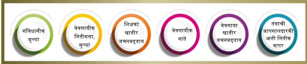
चित्र.3 मुळावी मुल्यां आनी नितामत्तेचें रेखाटण

4.1 मानक 1: मुखेल मुल्यां आनी निती- ह्या मानकांनी शिक्षकांनी विकास करपाची गरज आशिल्लीं मुळावीं मुल्यां आनी निती विशीं संबंदीत क्षेत्राचो आसपाव आसतलो. शिक्षकी वेवसायांत मुळावीं मुल्यां आनी निती हाचो म्हत्वाचो वांटो आसा. तीं मार्गदर्शक तत्वां जावन काम करतात, जे शिक्षकांच्या मुल्यांचो वेवसायीक विकासाचो आकार दितात जशें सत्यताय, वेवसायिकताय, प्रामाणीकपण, आदर, विस्वास आनी वर्गांत एकामेका मदीं समजूतदारपण आनी शिक्षकांक तांचें शिक्षणीक कौशल्य आनी सदांकाळ शिकप सदांच उदरगतीक पावोवंक मजत करतात. हीं मुळावीं मुल्यां आनी नितीमत्ता सांबाळून शिक्षकांचो एकवट आनी सगळ्यांचो आसपाव आशिल्ली बुन्याद तयार करता.