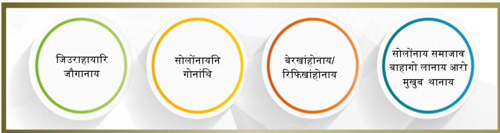
सावगारि - 5 जिउराहायारि बांहोनाय आरो जौगाथानि सावगारि फोरमायथि

4.3 मानदान्दा 3: जिउराहायारि बारायनाय जौगाथाइ - बे मानदान्दायाव सासे फोरोंगिरिखौ सोलिफु जिउराहायारि जौगाथाइ (CDP) नि थाखाय हावाफारिफोराव बाहागो लानायनि गेजेरजों मोनफ्रोमबो जिउखां खल'बाव जिउराहायारि गियान/हारोंथाइ आरो सर' खालामनायखौ साबखांहोनो मा मावनांगोन बेखौ मिजिंथिनायजों सोमोन्दो गोनं फोथारफोरखौ लानाय जादों। फोरोंगिरिफोरा जिउराहायारि सिनायथि महरै बिसोरनि हारोंथाइफोरखौ जौगाखांहोनो आरो बारायनो थाखाय जेब्लाबो नाजानांगौ आरो बिसोरनि जिउराहायारि सिनायथिखौ मान दोननांगोन। बे खाख्रियाव बाहायनाय हारोंथाइनि बाहायारि बेखेवथि बादिब्ला, गासै गियान, आखुथाइ आरो मावनो हानाय महरफोरा हारोंथाइयाव थागोन।