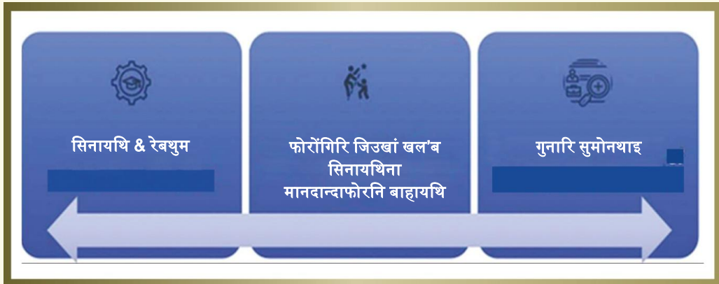
सावगारि 8: गिबि लामा फरायसं मावफुंनायनि सावगारि फोरमायथि