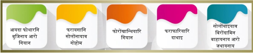
सावगारि - 4 गियान आरो सर' खालामनायनि सायाव सावगारि फोरमायथि

थांखिफोरनि गियान जारिमिन आरो खान्थिफोर, सोलोंनायनि थिरांथाइनि गियान आरो सोलोंसानि आयदानि थिखानाय गियान, आरो सोलोंथाइयारि सर' खालामनायनि गियान आरो मावनो हानाय आरो मुवाखौ मावनायनि सासे सुबुंनि सरासनस्त्रा गुनजों सरजाबफानाय गियान आरो सर' खालामनाय। फरायसाफोरखौ ओंथिगोनाडै आरो सरजाबफानानै, बिथांखि लानो, फोरोंनो, सुनो आरो रिफिखांहोनो सायख'नो, जौगाखांहोनो आरो फुंखाफोरखौ बाहायनो, गुबुन गुबुन फराफारियारि साइटफोराव सोलोंनायनि रंमोनथाइफोरखौ दैदेनलानो आरो थाखो खथा, बिजाब बाख्रि, बाहायखान्थि, बिजाबबाख्रि, जायगा दावबायनाय दरखं/लांगोना आरो गेलेग्रा फोथार आरो गासै फरायसाफोरखौ गासै बिथिडाव जौगानायखौ मदद होनो एजेन्शि जानायनि गियान थानांगोन।