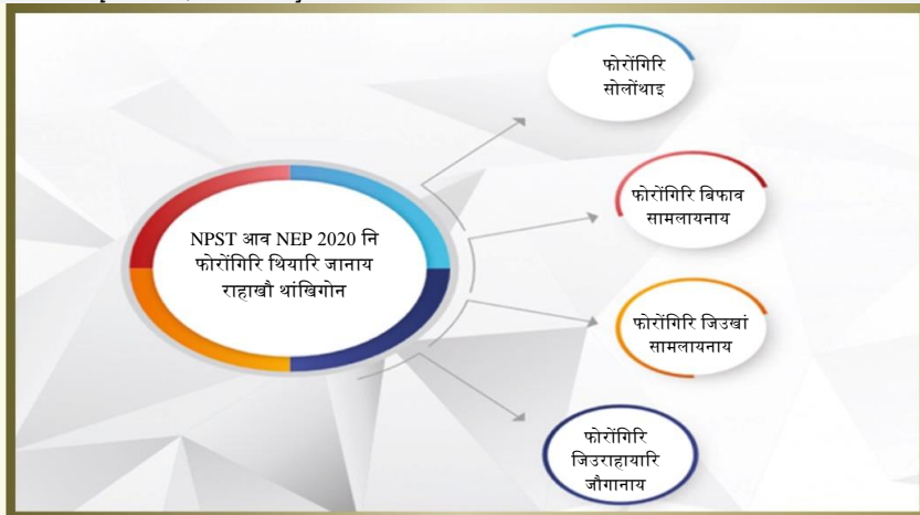
सावगारि - 1 फोरोंगिरिफोरनि थियारिथिनि सायाव सावगारि बेखेवथि (फोरमायथि)

"NCERT, SCERT, बायदि थाखो आरो ओनसोलफोरनि फोरोंगिरिफोर, फोरोंगिरि थियारि खालामनाय आरो जौगानायाव रोंगौथिगोनां आफादफोर, जिउराहायारि/भकेशनेल सोलोंथाइयाव रोंगौथिगोनां आफादफोर, आरो जौसिन सोलोंथाइ फसंथानफोरजों सावरायनानै सरासनन्ना सोलोंथाइ गौथुम (GEC) नि सिडाव मोनसे जिउराहायारि मानदान्दा थि खालामनाय आफाद (PSSB) महरै गावनि दाफिनजानाय गोदान महराव फोरोंगिरि सोलोंथाइनि हायुडारारि गौथुमजों (NCTE जों) 2022 मायथाइसिमाव फोरोंगिरिफोरनि हायुडारि जिउराहायारि मानदान्दा (NPST) नि मोनसे सरासनन्ना दिन्थिलामा होनाय जथायखौ जौगाहोनाय जागोन। मानदान्दाया रोंगौथिगोनां/थाखोनि गुबुन-गुबुन थाखोफोराव फोरोंगिरिनि बिफावनि मिजिंथिफोर आरो वै थाखोनि थाखाय गोनां जानाय हारोंथाइखौ लाफागोन। बेयाव मोनफ्रोम थाखोनि थाखाय दिन्थिफुनायखौ बिजिरनायनि मानदान्दाबो थाफानाय जागोन, जायखौ सम-सम बिथायाव खालामनाय जागोन। NPST आ आगु-मावमिन फोरोंगिरि सोलोंथाइ हाबाफारिफोरनि महरखौबो फोरमायगोन। बेनि उनाव बेखौ राज्योफोरा नाजावनो हायो आरो फोरोंगिरि जिउखां सामलायनायनि गासिबो बिथिफोरखौ थि खालामनो हायो, जेराव समगान्थि, जिउराहायारि जौगाखां नाजानाय, मावबान्था बारायनाय, मासि जौगानाय आरो गुबुन गनायथि रोंनायफोर दं। मासि जौगानाय आरो मावबान्था बारायनाय समगान्थिनि गोलावथि एबा देरसिनथिनि सायाव सोनारनाय नडा, नाथाय बेबादि गुन/बेसेन बिजिरनायनि सायावल' सोनारनाय जागोन। जिउराहायारि मानदान्दाफोरखौ 2030 मायथाइयाव नायसंनाय आरो फोसावनाय जागोन, आरो बेनि उनाव मोनफ्रोम 10 बोसोराव, आदवनि आखा-फाखाथिनि गोब्राव रोंमोन्दांथिगोनां बिजिरनायनि बिथायाव" [पैरा 5.20, NEP 2020]]