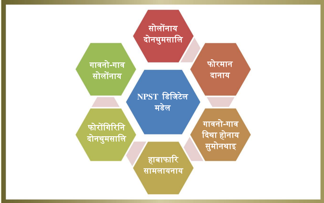
सावगारि 7: डिजिटल मडेलनि बिदिन्थि सावगारि फोरमायथि