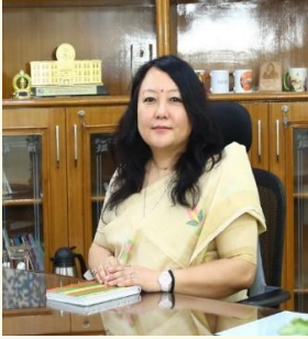
(केसां वाइ. शेरपा, आइआरएस) नेहाथारि सोद्रोमा, NCTE, गोदान दिल्ली

भारताव गुनगोनां फोरोंगिरि सोलेंथाइ जौगाखां होनायनि फारसे फोरोंगिरि सोलेंथाइनि हायुडारि गौथुम (NCTE) आ माखासे मावजेन हाबाफारि लादों। NEP 2020 आ गुनगोनां फोरोंनाय आरो सोलेंनाय मावफारिखान्थिनि मोनसे गोनांथार आगु गोनांथि महरै जौगा गुनगोनां फोरोंगिरिखौ सिनायथिदों। बे रोखोमसे सानस्त्रिजों, NCTE आ NEP 2020 नि खोन्दोफारि 5.20 आव इयुन मिजिंथिनाय बादि फोरोंगिरिफोरनि हायुडारि जिउरायारि मानदान्दा (NPST) दिन्थिलामा खाख्रियाव होनायबादि फोरोंगिरिफोरनि थाखाय जिउराहायारि मानदान्दायाव 21थि जौथाइयाव गोहोमगोनां फोरोंनायनि फारसे बिसोरनि जिउखां जौगाहोनायाव फोरोंगिरिफोरा माखौ मिथिनांगौ, माबोरै मावनांगौ बेखौ फोरमायनाय मोनसे थख'लाइ दं। NPST आ सासे फोरोंगिरिफ्राय गुबुन गुबुन खल'बनि सोलोनि गुन आरो/एबा जिउखांनि बायदि रोखोमनि थाखोआव हारेंथाइफोरनि रेंमोन्दांथि आरो मिजिंथिनाय सरजाबगोन।