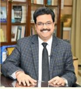
(प्र. यगेस सिं) मासिगिरि, NCTE, गोदान दिल्ली

हायुडारि सोलेंथाइ खान्थि 2020 आ जौगा गुनगोनां फोरोंनायनि सायाव गोनांथि होदें जाय 21थि जौथाइनि सोलोफोर खानानै होनाय आरो फोरोंगिरिफोरनि हाबा मावनायनि खाबुखौ दिन्थियो। फोरोंगिरिफोरनि हायुडारि जिउराहायारि मानदान्दा (NPST) जौगाखांहोनाया जौनि फरायसाफोरनि सोलेंथाइयारि थांखिफोरखौ सुफुनायनि फारसे सोलोगोरों फोरोंगिरि सोरजिनायनि थांखि। NPST आ फोरोंगिरिफोरनि थाखाय हाबा मावनाय सोलिनायाव बांसिन मोननो हाथाव मानदान्दा मोनफुनो मोनसे जौसां होयो। NPST आव बेखेवथि होनाय महरै सरासनन्ना मानदान्दाया फोरोंगिरिफोरनि हाबा मावनायनि आखल आखु, बोसोनखान्थिफोर, आयदानि गोख्रों गियाननि सायाव नोजोर होयो।