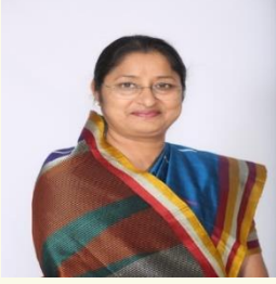
(अन्नपूर्णा देवी) राज्योआरि मन्थ्रि, सोलोंथाइ बिफान, भारत सरकार

फोरोंगिरिफोरनि हायुडारि जिउराहायारि मानदान्दा (NPST) आ साफ्रोमनोबो गुनगोनां सोलोंथाइ होनायखौ थि खालामनो आरो फोरोंनाय जिउराहाखौ गोजौवाव दैखानायनि बाश्रा होनायाव मोनसे मख'जाथाव माइलखुन्थिया गाइसंदों। NPST दिन्थिलामा खाख्रिया सोलोंथाइगिरिफोर, रोंग'साफोर, रोंग'सा आफादफोर, आरो बे फोथारनि बाहागोदारफोरजों गोथौवै सावरायनानै, बिजिरसनानै आरो हेफाजाब होलायनानै दाजानाय जाबाय। बेफोर मानदान्दाफोरा 21थि जौथाइनि गोहोमगोनां फोरोंनाय होनना बेखेवथि होनाय गोनांथार गियान, सोलो आरो जोनोमारि गुनफोरखौ रोखायै फोरमायगोन। NPST दिन्थिलामा खाख्रिया फोरोंगिरिफोरनि थाखाय रोखा मिजिंथिनाय गायसननायनि आवुं दाथाइखौल' होनाय नडा नाथाय बे जिउखां सामलायनायाव फोरमान दानाय आरो आयदानि गियान, सोलिफुयै आखल आरो बोसोनखान्थि जौगाहोनायनि मोनसे आरिमुखौबो गेवलांसार होयो।